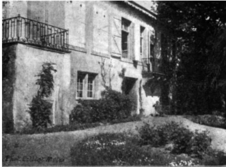
Le « Manoir » — Extérieur (Renaissance)