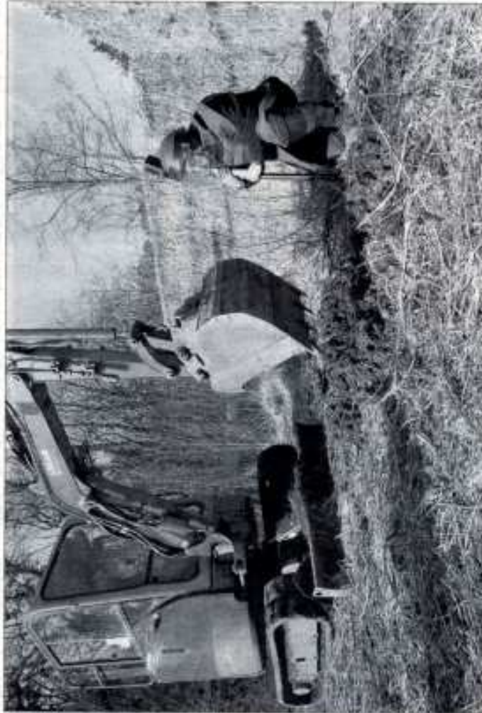
Près de 2 000 cibles ont été mises au jour par les démineurs de la société Géomines à laquelle l'Esid a confié la dépollution pyrotechnique des anciens terrains militaires du mont Saint-Quentin.

Si tout se passe comme prévu, coordonné par la préfecture de la Moselle, le chantier de dépollution devrait s'achever à la mi-avril, mais tant qu'ils n'auront pas été cédés à Metz Métropole, les terrains resteront fermés au public. Pour l'heure, aucune date n'a été rendue officielle. Dans le futur, sur une emprise totale de 400 hectares, la zone et ses